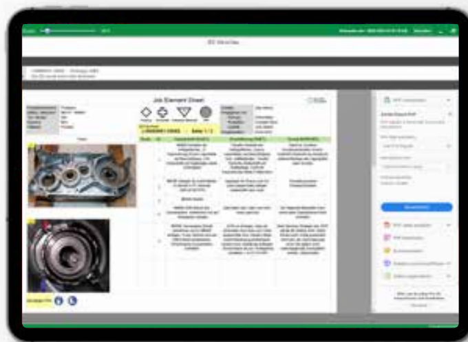
Erstellen von JES